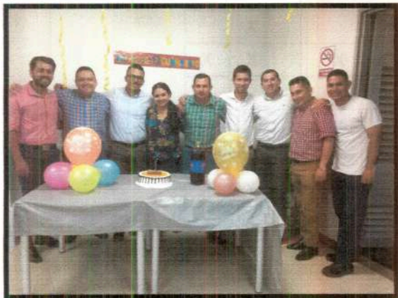
Cumpleaños I Semestre