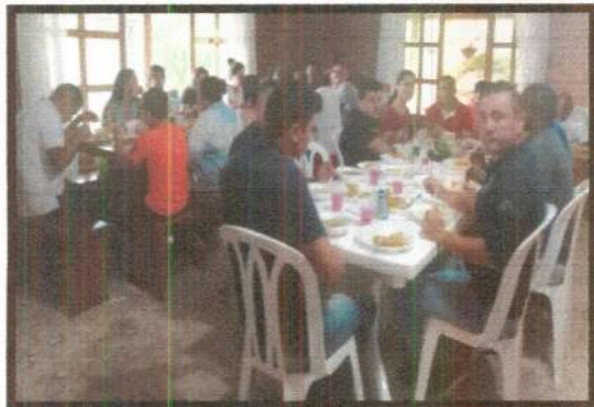
Día de la Madre y del Padre