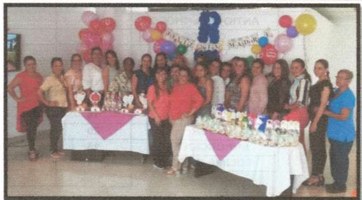
Día de la Madre

De acuerdo a la información de los cuadros anteriores, se puede evidenciar que 7 Regionales y la Oficina Principal, cumplieron al 100% con lo programado.