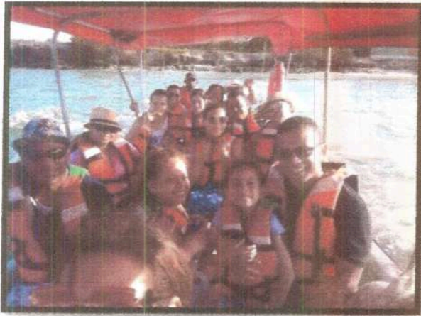
Día de la Familia