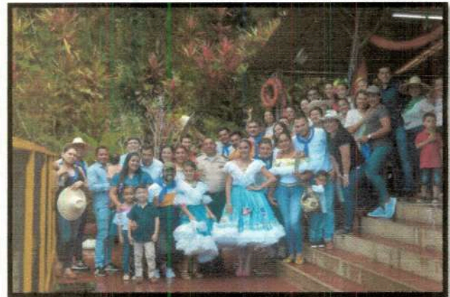
Día de la Familia