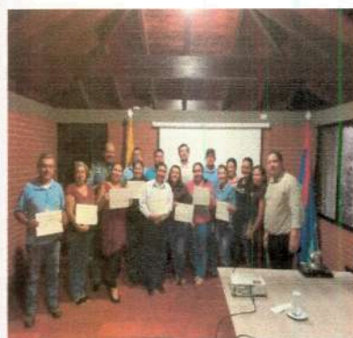
Regional Llanos Orientales Plan Estratégico Seguridad Vial