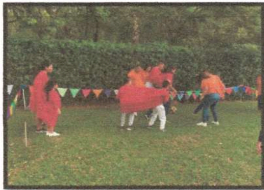
Día de la Familia