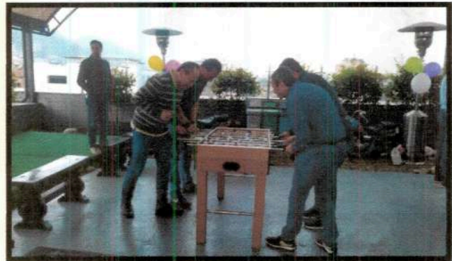
Día del Hombre