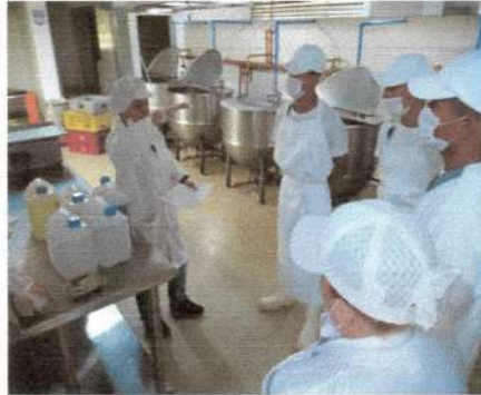
Manipulación de Alimentos Regional Tolima Grande