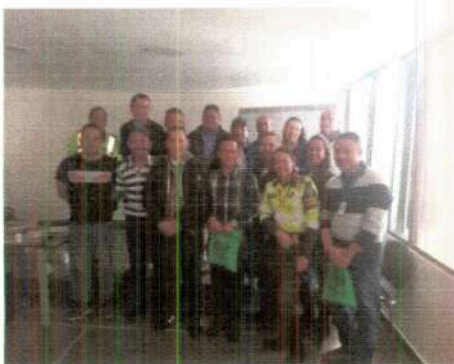
Capacitación Plan Estratégico Seguridad Vial, Oficina Principal

A continuación un registro fotográfico de las capacitaciones efectuadas a Nivel Nacional.