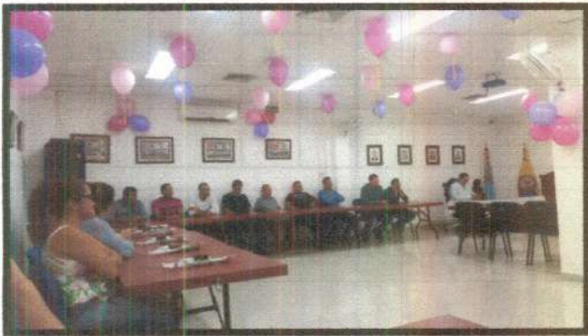
Día de la Mujer