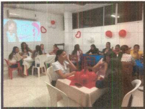
Día de la Madre