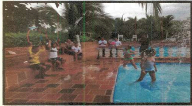
Día de la Familia