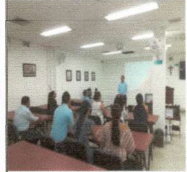
Seguridad Informática Regional Nororient