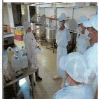
Manipulación de Alimentos Regional Tolima Grande