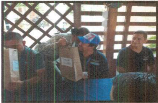
Día del Padre