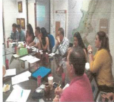
Seguridad Informática Regional Sur Occidente